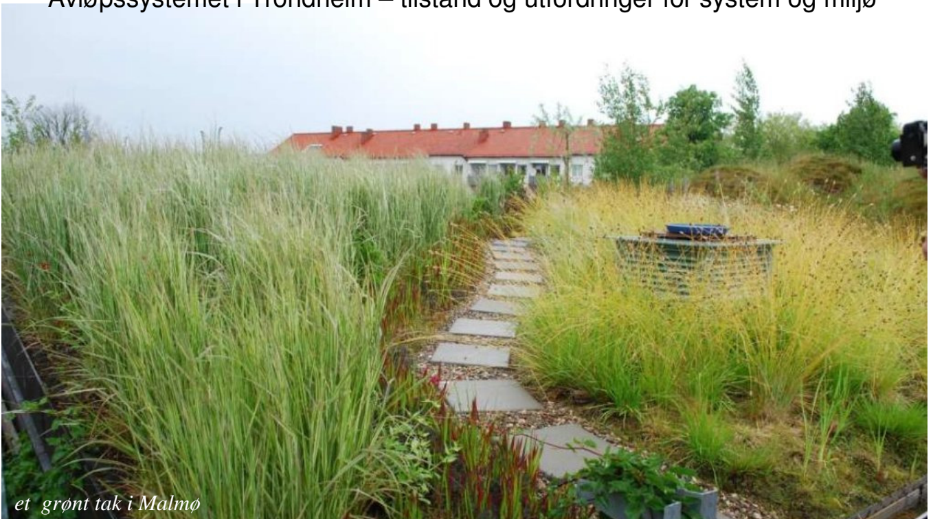
et grønt tak i Malmø

Avløpssystemet i Trondheim – tilstand og utfordringer for system og miljø