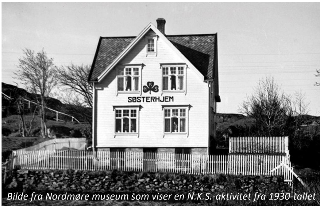
Bilde fra Nordmøre museum som viser en N.K.S.-aktivitet fra 1930-tallet

N.K.S., Norske Kvinners Sanitetsforening, er en frivillig organisasjon som siden 1896 har vært en viktig samfunnsaktør.